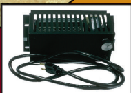
Ventilateur / Blower